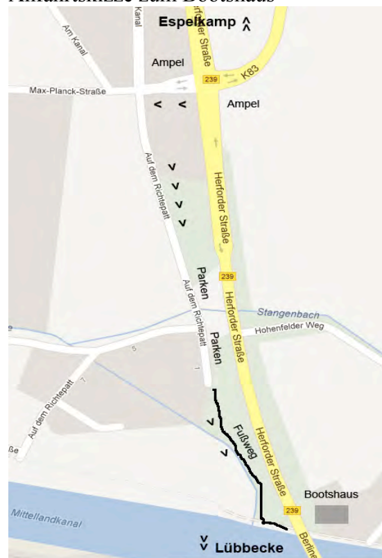
Anfahrtskizze zum Bootshaus