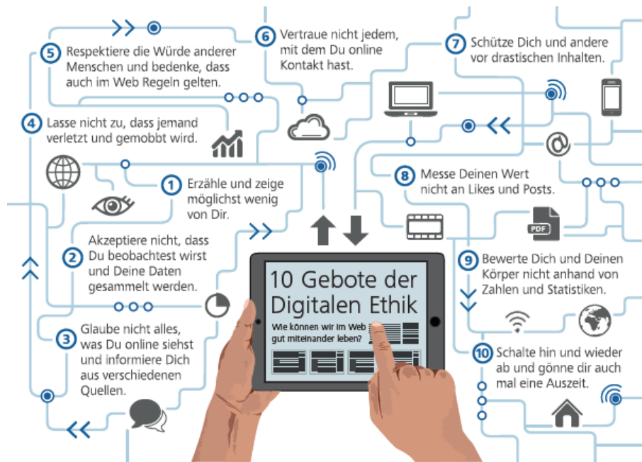
Zehn Gebote der digitalen Ethik